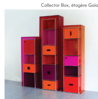
Collector Box, étagère Gaïa

les modules de rangement Collector Box et Magnetic Box s'assemblent au gré des envies et des besoins grâce à de petits aimants, créant un concept d'étagères sur mesure, évolutif et adapté à tous les intérieurs. ■