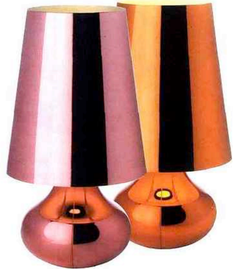
3-Inspirée des petites lampes aux allures seventies, Cindy, éditée par Kartell est composée d'un abat-jour conique et d'une base arrondie mais réapparaît avec un look très moderne. Revêtue d'une finition métallisée à l'aspect noir, elle se décline dans divers coloris chatoyants très actuels. Créée par le célèbre designer Ferruccio Laviani , elle pourrait bien devenir le nouveau best-seller du luminaire Kartell !