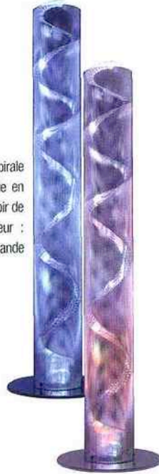
2-Petite Colonne spirale LED violette / bleue en inox perforé poli miroir de Thierry Vidé Hauteur : 82 cm. Télécommande incluse.