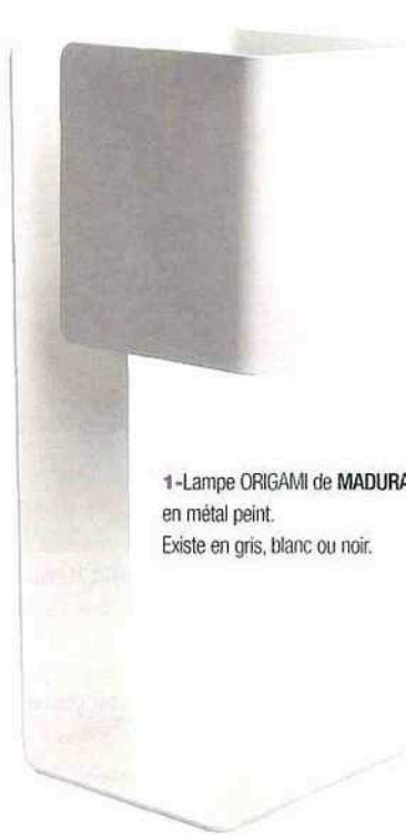
1-Lampe ORIGAMI de MADURA en métal peint. Existe en gris, blanc ou noir.