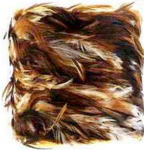
4-Hervé Matejewski apporte une nouvelle dimension à ces créations en déclinant dans une version mini ses fameuses lampes plumes : les Mini Mate (environ 30cm).

Des luminaires tendances pour personnaliser votre intérieur.