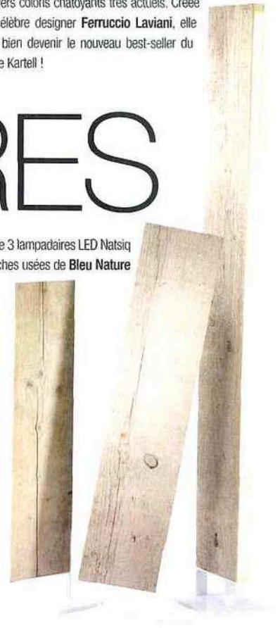
6-Set de 3 lampadaires LED Natsiq en planches usées de Bleu Nature